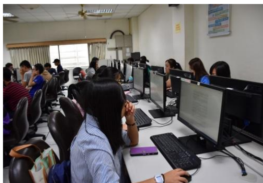
學生 UCAN 職能診斷

本校針對學生施測結果進行課程及活動規劃的改善，加強學生職能較不足的部分(溝通表達及創新)，詳見表 1-1。學生經過近三年的培育與訓練，透過第二次施測，進行前後測分析比較，從表 1-1 得知，學生原本較不足的職能溝通表達和創新皆有進步，且溝通表達有顯著的進步，即表示本校改善與強化是有所成效的。