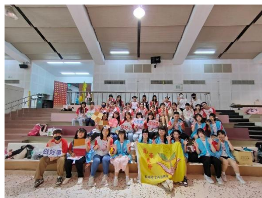
112 學年度就業服務計畫-幼教系企業參訪