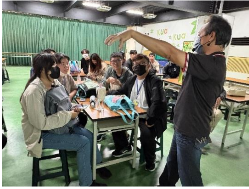
瓜瓜園導覽員講解