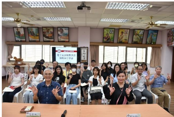
e-Portfolio 電子履歷競賽大合照