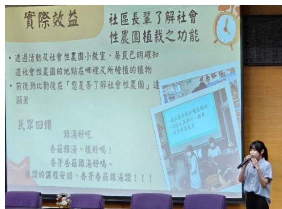
應社系實習成果發表會