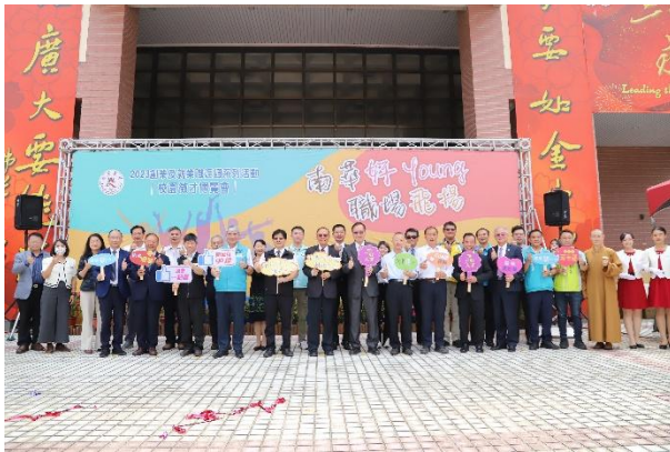
112 學年度校園徵才博覽會

校園徵才博覽會，邀請優質廠商蒞校徵才，提供學生多元實習及就業。112 學年度年邀請 50 家廠商徵才，共 806 人參與，媒合率 80.15%。參加學生與企業交流，使廠商能從校園中找到所需之人力資源，也使本校學生於畢業前，親身體驗求職流程、累積求職經驗，讓學生能順利轉銜至職場。學生參加校園徵才博覽會活動後表示：「透過參加徵才博覽會直接地與職場業界人士面談，藉由提問及討論交流，讓我知道自己對於職業的條件是否足夠，不足的部分利用在校期間補強，對未來進入職場有加分的效果。」