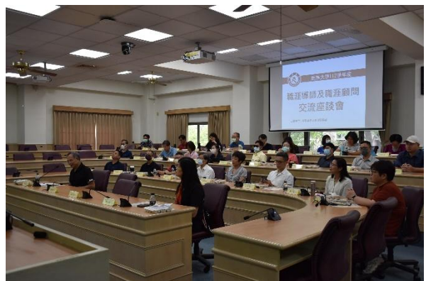
職涯導師及職涯顧問交流座談會