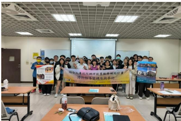
112 學年度就業服務計畫-視設系就業講座