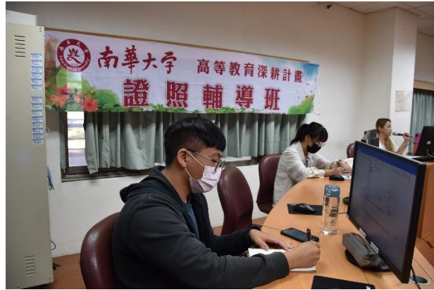
MOS 系列證照輔導班-學生動作筆記