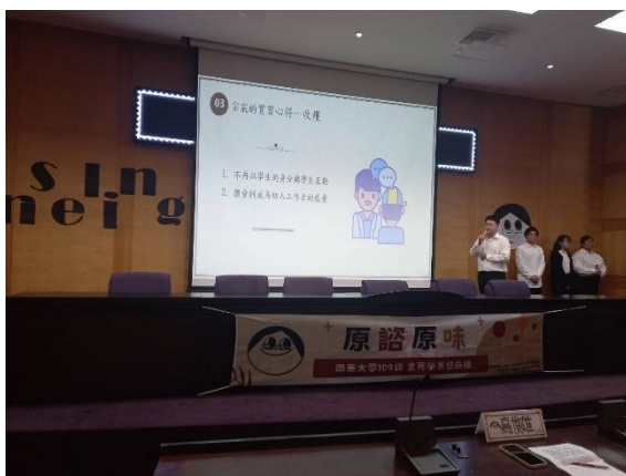
生死系諮商實習成果發表會

依據本校學生實習辦法各系、所、學程應於實習結束後,舉辦實習成果發表會,邀請實習合作機構代表、實習輔導老師及全校師生參與。透過實習成果發表會的交流意見回饋改善實習課程,精進課程內容。112 學年度共辦理 4 場實習成果發表會,共 452 人參加。