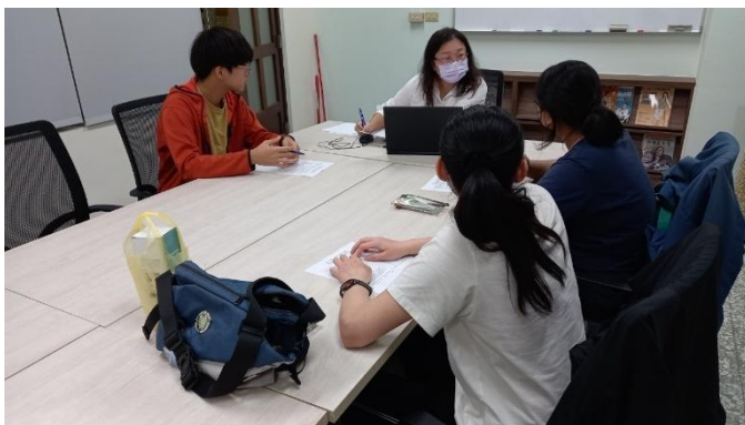
職涯顧問進行團體輔導

學生接受職涯導師輔導諮詢活動後表示：「在接受職涯導師的輔導後，我對未來的方向變得更清晰了。原本對職涯充滿不安與疑惑，但在老師的耐心引導下，了解到自己需要加強的地方，也重新確立了努力的目標。導師不僅給予實用的建議，也讓我更有信心面對未來，覺得這樣的輔導對我幫助很大」。