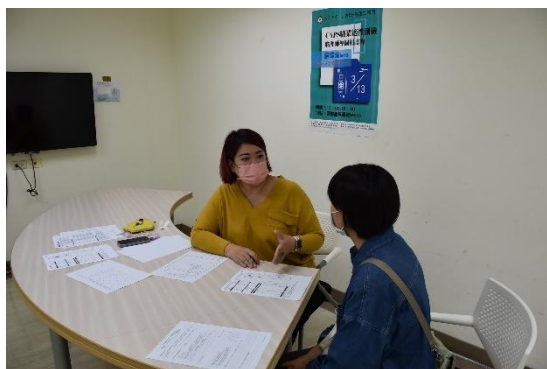
CPAS 適性測驗一對一輔導晤談

的職涯方向與適合的發展領域。原本對所學與未來職業是否匹配感到不確定，但在顧問的分析與建議下，發現自己可以依照優勢來規劃未來，也明白哪些部分需要再加強。」