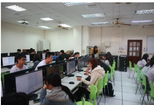
導師向學生說明如何進行 UUCAN 施測

學生在 UCAN 施測後表示：「透過這次 UCAN 施測，我更清楚了解自己的興趣和能力在哪些地方需要加強，也發現原來有些職能是未來職場很重要的。這讓我開始思考自己想走的方向，知道該往哪裡努力去補足不足的部分。」