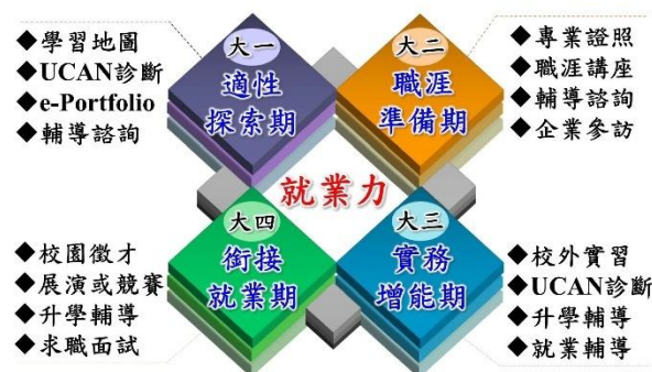
圖 1 四年一貫職涯輔導機制

本校強調「學用合一」，強化各項教學內容與實務、產業、社會發展趨勢充分連結，為彰顯協助學生職涯發展輔導之工作目標，有效輔導學生的生涯及職涯發展，並能協助提升其就業力與競爭力，於 104 學年度設置一級單位「產學合作及職涯發展處」，打造結合產學雙能量、輔導學生就業與創業職涯發展願景的全方位服務，並規劃四年一貫職涯輔導(詳見圖 1)為學生職涯發展輔導主軸，其內容為：一、適性探索期；二、職涯準備期；三、實務增能期；四、銜接就業期。相關職涯輔導措施如下：