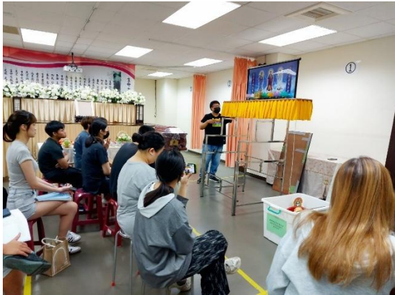
喪禮服務丙級證照班-靈堂搭設實作

學生參與證照班並取得證照後表示：「參加證照輔導班後，我覺得收穫很多。課程內容實用又有系統，老師的講解讓我更清楚考試重點與方向。學校提供的報名費補助也讓我更有動力去挑戰證照。拿到證照後，不僅提升了專業能力，也讓我在求職時更有自信，相信這對未來進入職場會有很大的幫助。」