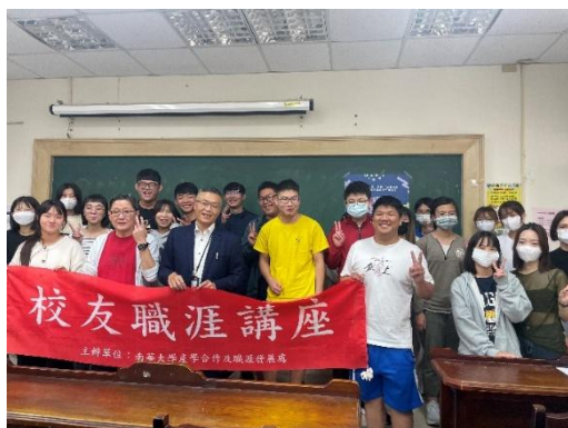
校友職涯講座-學長、老師學弟妹大合照

學生參與職涯輔導活動後表示：「很感謝學校邀請專家來為大家演講，講座中能聽到講者分享自己的失敗經驗、轉變的心路歷程等，這些分享都是平時較少接觸的。」