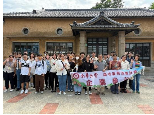
大目降文化園區大合照