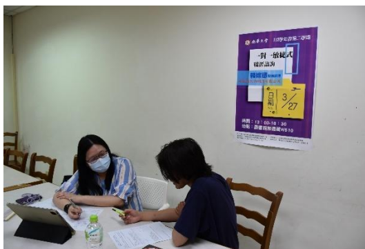
一對一敏捷式職涯諮詢