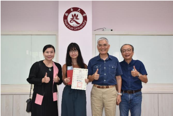
獲獎同學偕同班導師與校長和副校長合照

整理自己的學習成果與經歷，不僅更了解自己在大學期間的成長，也能反思未來的方向。有競賽制度讓我更有動力去完善履歷內容，過程中學到如何更有條理地呈現自己的優勢，對未來升學或求職都很有幫助。」。