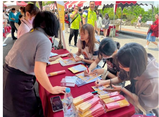
112 學年度校園徵才博覽會